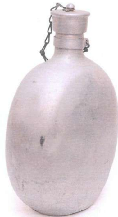
Чутура за воду српског војника (Приватна колекција Дејана Мартиновића)