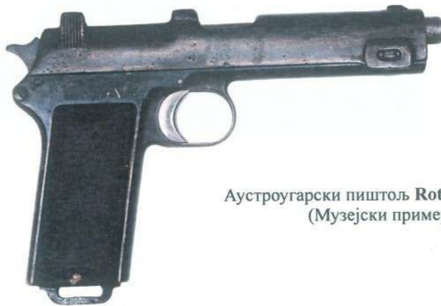
Аустроугарски пиштољ Roth Steyr M1911 (Музејски примерак)