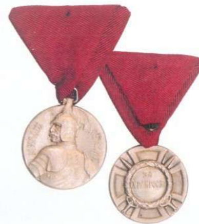
Орден за храброст „Милош Обилић“