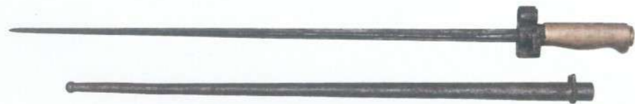
Бајонет за француску пушку „Лебел“ Наоружање српске војске на Солунском фронту и по завршетку рата инв. бр. 66 – Завичајни музеј Јагодина