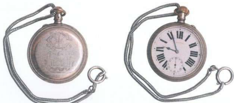
Предратни џепни сат „Longines“ Српске државне железнице (Приватна колекција Дејана Мартиновића)