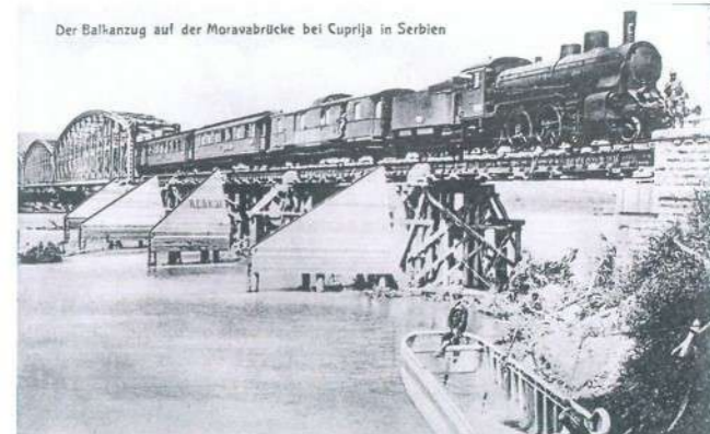
Balkanzug прелази железнички мост на Морави код Ћуприје