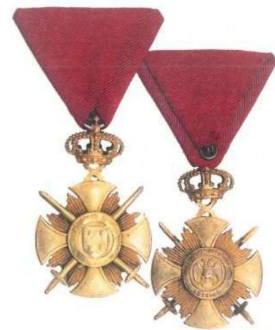
Орден „Карађорђева звезда са мачевима“