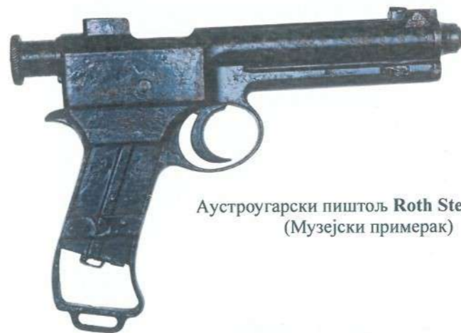
Аустроугарски пиштољ Roth Steyr M1907 (Музејски примерак)