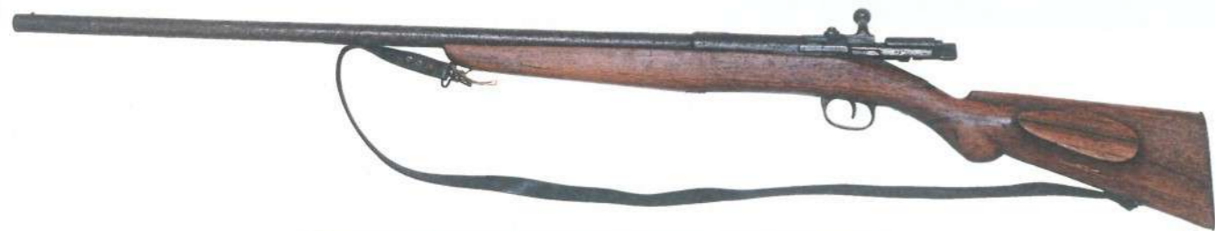
Преправљена турска пушка система Маузер М1890 (оригинална цев са механизмом) Произведена 1891-1892. године инв. бр. 126 – Завичајни музеј Јагодина