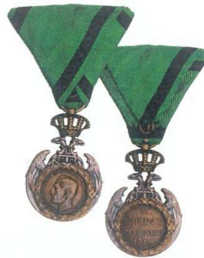
Орден „Албанска споменица“