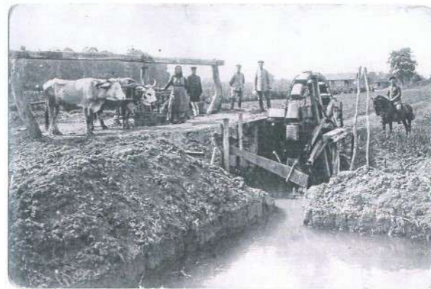
На принудном раду код Немаца у Ади 1916. године