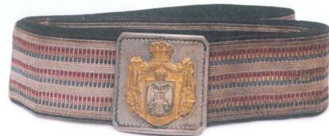
Парадни опасач официра војске Краљевине Југославије (Приватна колекција Дејана Мартиновића)