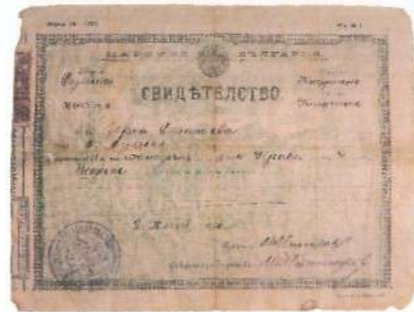
Бугарски документ сведителство из 1916. године, ЦКУ 3166/87 (Завичајни музеј Јагодина)