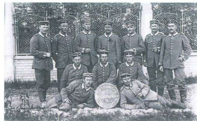
Аустоугарски воји оркестар – У знак сећања на команду у Ћуприји