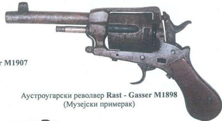
Аустроугарски револвер Rast - Gasser M1898 (Музејски примерак)