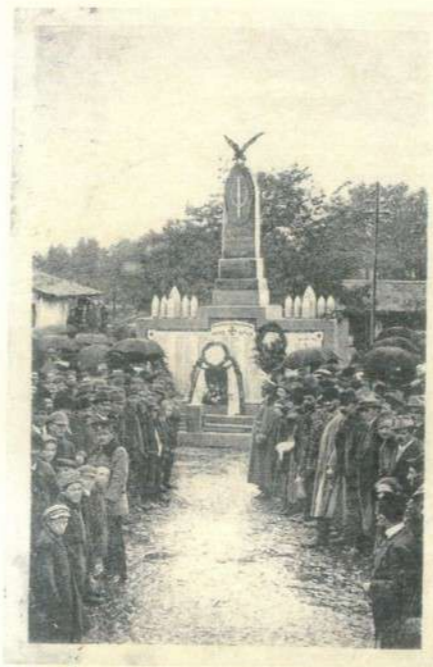
Откривање и освећивање споменика борцима погинулим у ослободилачким ратовима 1912 - 1918. године.

Тамо далеко, далеко од мора, Тамо је село моје, тамо је Србија.